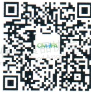
(支付宝缴费二维码)